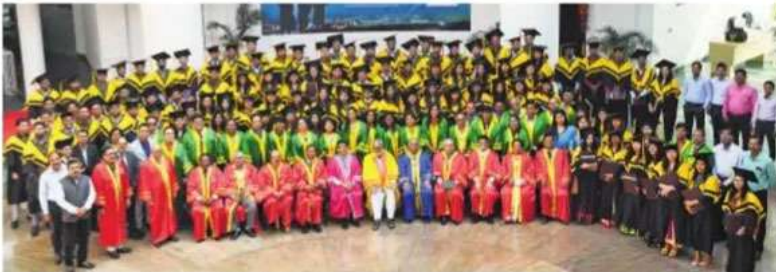
ON THAT AUSPICIOUS DAY: Group picture taken during the annual convocation of Birla Global University